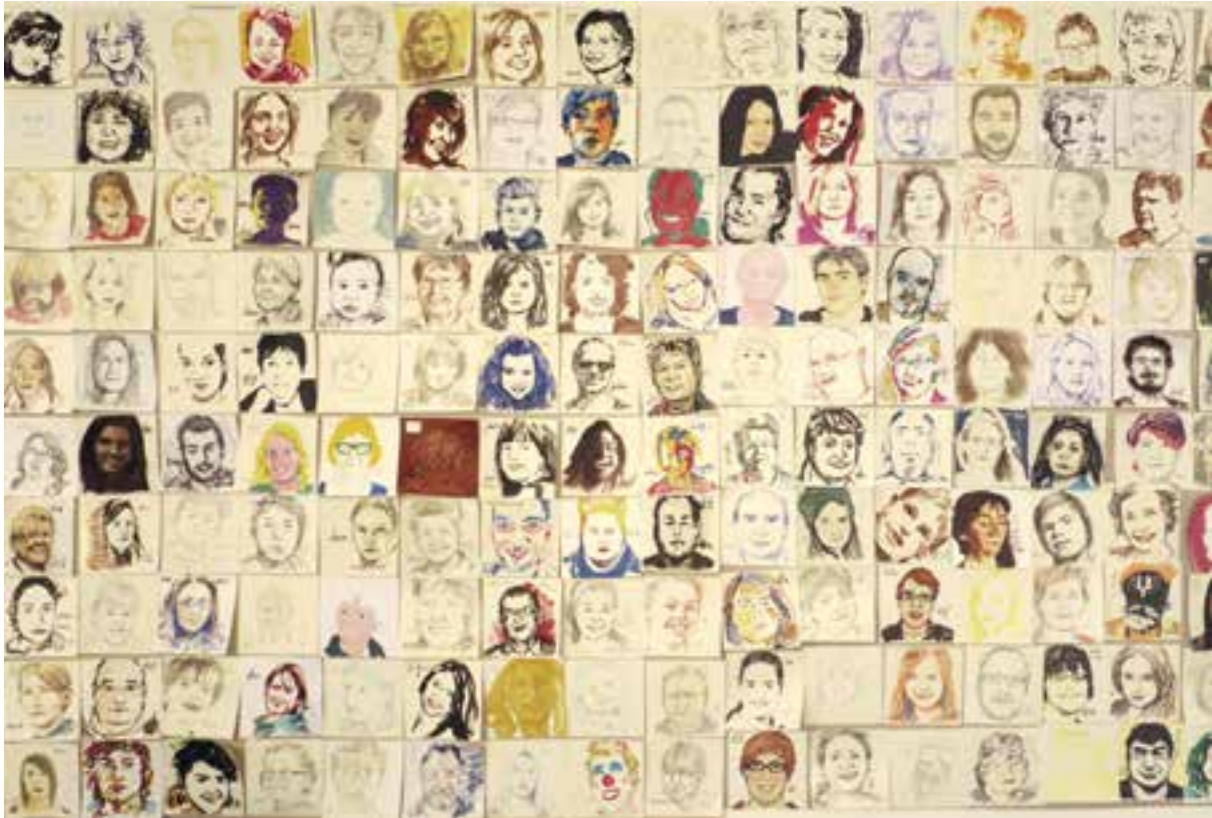
Beispiel für Bilder, mit verschiedenen Medien gemalt/gezeichnet. Die Anordnung entspricht nicht dem endgültigen Ergebnis.